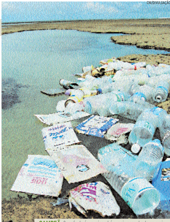
CAMPEÃ Garrafa de água mineral é a mais encontrada na praia