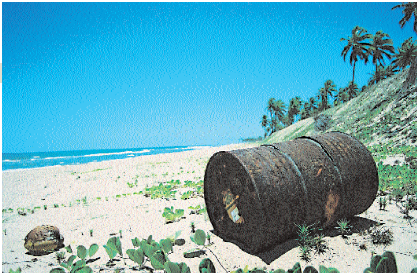
SUJEIRA Dejetos são descartados dos navios durante o dia e depois se juntam aos resíduos jogados nas praias trazendo prejuízos à fauna nacional

a bordo durante a viagem tenha que ser jogado ao mar antes da chegada às águas territoriais dos países de destino”, revelou. Para ele, a maioria dos navios atira lixo ao mar. “Normalmente o descarte é feito à luz do dia, durante a jornada de trabalho do encarregado de cozinha”, explica.