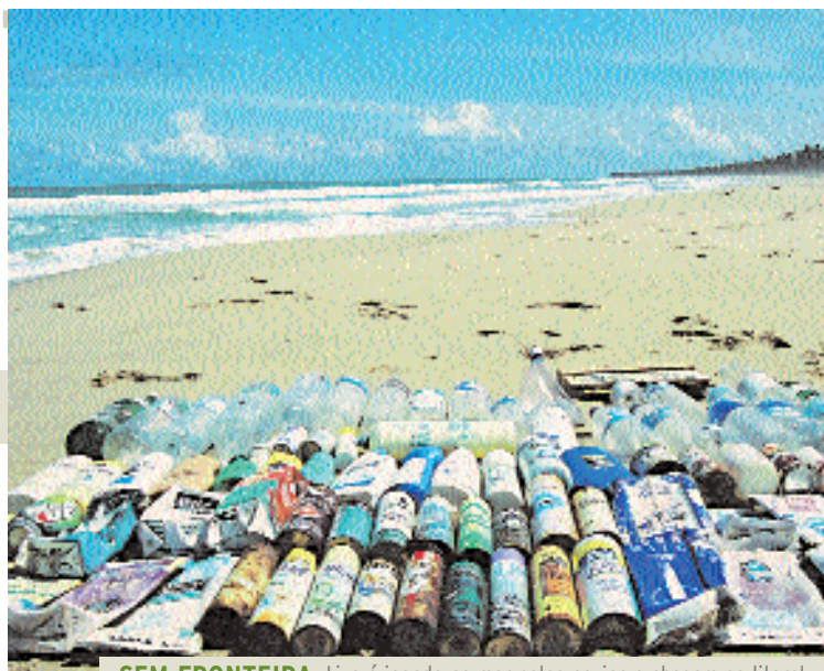
SEM FRONTEIRA Lixo é jogado no mar pelos navios e chegam ao litoral