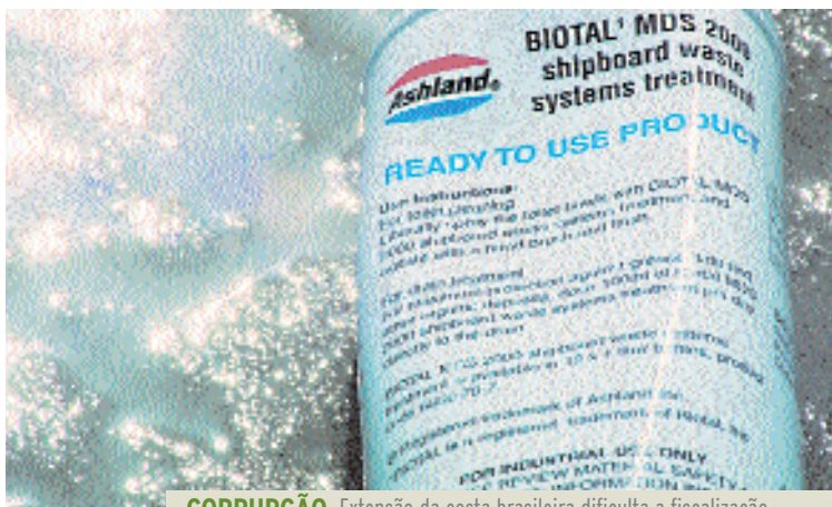
CORRUPÇÃO Extensão da costa brasileira dificulta a fiscalização

não tem nacionalidade”, ressaltou o superintendente. Para ele, a solução seria a cobrança compulsória de uma taxa de lixo incorporada à taxa de utilização do porto. Ihssen acha que a coleta diária do lixo deveria ser oferecida pelo porto, através de serviço próprio ou terceirizado, nos moldes dos serviços oferecidos pelas prefeituras.