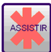
Asistencia Médica en Traslado