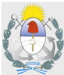
MUNICIPALIDAD DEL PARTIDO DE GRAL. PUEYRREDÓN