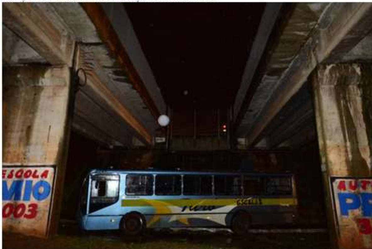
Cena de uma tragédia: depois que a água baixou, ônibus ficou quebrado

Publicação: 08/10/2013 21:56 Atualização: 09/10/2013 15:00